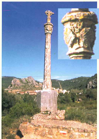
Cruz de la Horca

desde donde se divisan equidistantes la villa de Andilla y La Pobleta. En este lugar se ajusticiaba a los reos de muerte en tiempos pretéritos y, habida cuenta que los cuerpos se dejaban colgados durante un tiempo, servían de ejemplo para los habitantes de ambas poblaciones que podían verlos desde sus casas.